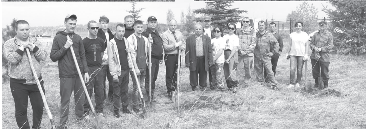
На территории 12 микрорайона Кудымкара высажено более ста саженцев лип и кедров