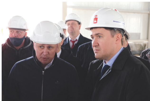
Дмитрий Махонин инспектирует ход строительства крытого ледового катка в Соликамске

В 2021 году в Пермском крае также будет построено 8 межшкольных стадионов – они появятся в посёлках Сыльва и Юг, в Соликамском, Добрянском и Чайковском городских округах, в Косинском районе и в Перми. Ещё планируется построить 2 физкультурно-оздоровительных комплекса, на оснащение которых регион получит 40 миллионов рублей. Это будут стадионы с футбольным полем, зонами для лёгкой атлетики и хоккейной корбкой, на которой летом можно играть в волейбол и баскетбол. Комплекс будет оборудован и разборными трибунами на 100 мест с пространством для хранения инвентаря. Территории, в которых построят объекты, определяют конкурсным путём – как раз сейчас идёт отбор.