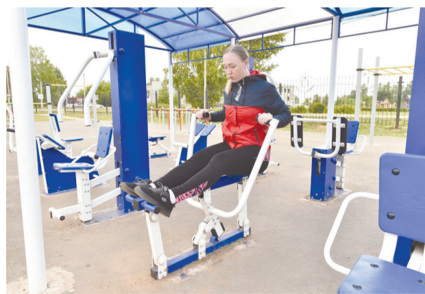
Жители посёлка Ильинского занимаются на тренажёрах на местном стадионе «Радуга»