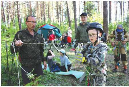
По чудским тропам в поисках чудских кладов