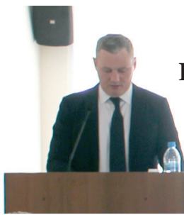
Глава округа отчитался перед депутатами о работе за 2020 год