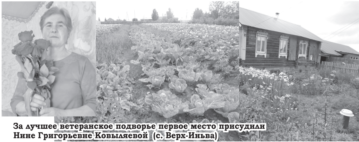
За лучшее ветеранское подворье первое место присудили Нине Григорьевне Ковыляевой (с. Верх-Иньва)

В Кудымкарском муниципальном округе Пермского края проживает 5074 человека, кого поздравляют во время месячника, посвящённого Дню пожилого человека. Это люди, кто сегодня находится на заслуженном отдыхе.