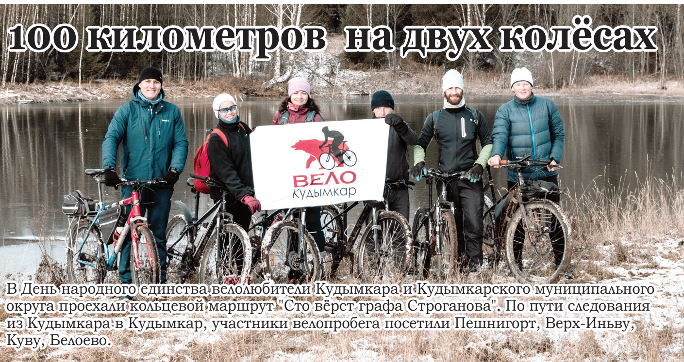
В День народного единства велолюбители Кудымкара и Кудымкарского муниципального округа проехали кольцевой маршрут "Сто вёрст графа Строганова". По пути следования из Кудымкара в Кудымкар, участники велопробега посетили Пешнигорт, Верх-Иньву, Куву, Белоево.