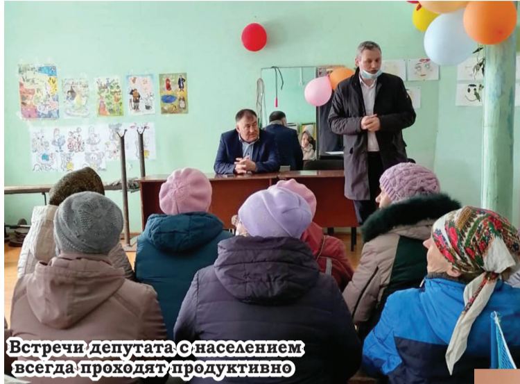
Встречи депутата с населением всегда проходят продуктивно