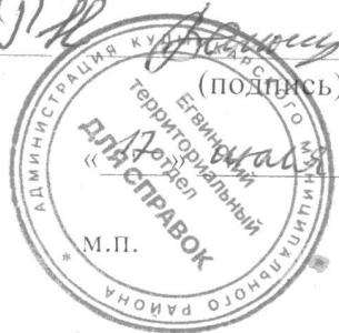
График (маршрут) сбора и вывоза твердых коммунальных отходов от населения Ёгвинского сельского поселения Кудымкарского муниципального района (Корчевнинская территория территория) третье воскресенье месяца на 3 квартал 2019 года