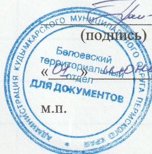
График (маршрут) сбора и вывоза твердых коммунальных отходов от населения Белооевского территориального отдела Кудымкарского муниципального округа