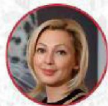
ТИМОФЕЕВА ОЛЬГА ВИКТОРОВНА

Полномочный представитель президента РФ в СКФО