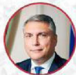
МАТОВНИКОВ АЛЕКСАНДР АНАТОЛЬЕВИЧ

Полномочный представитель президента РФ в СКФО