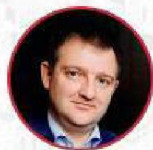
БУГАЕВ АЛЕКСАНДР ВЯЧЕСЛАВОВИЧ

Заместитель председателя Государственной думы Федерального собрания РФ